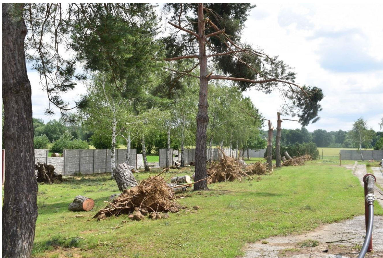
Obr. 1. Vyvrácené a polámané borovice u fotbalového hřiště.